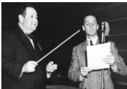
Korngold e l'attore Basil Rathbone negli studi della NBC

«Un genio!». L'esclamazione sfuggita a Gustav Mahler nel 1906 di fronte alla prima partitura di Erich Wolfgang Korngold pesava come un macigno: per un ragazzo che doveva ancora compiere dieci anni suonava come una predestinazione, una vocazione alla quale tener fede a tutti i costi. Niente distrazioni: quel talento andava coltivato con la massima serietà. Il padre, Julius, non aspettava altro: noto critico musicale del tempo, aveva segretamente sperato di riuscire ad allevare un buon musicista; quel secondo nome rubato a Mozart sembrava più un auspicio che un semplice connotato anagrafico.